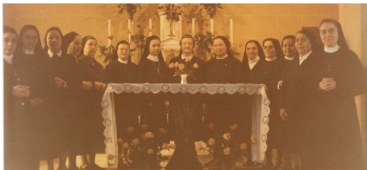
La communauté de Rome entre 1980 et 1990

Les sœurs italiennes faisaient partie de la Province de France jusqu'en 1970. Toutes elles ont fait leur noviciat en France, elles ont appris la langue et certaines d'entre elles ont servi dans différentes communautés en France et au Maroc.