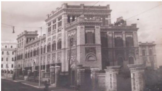
Maison de Rome : Villa San Pietro

En 1913 la Congrégation y acheta un terrain sur lequel fut construite la maison de Rome, que beaucoup d'entre nous ont connue. Elle est construite sur les catacombes de Ponthien. Les travaux ont mis longtemps à cause de la 1 re guerre mondiale, mais en 1920 les sœurs qui vivaient et travaillaient déjà au Monteverde, purent y établir leurs œuvres éducatives et sociales. Il y avait des classes maternelles et des classes primaires, entre 350 et 400 élèves. L'école était reconnue par l'Etat et les élèves passaient les examens de l'Etat.