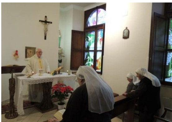
La Chapelle après la restauration

L'école de Rome est fermée en 1986. Les sœurs continuent leur présence dans la Ville Sainte par l'accueil de nos sœurs en pèlerinage, en session ou aux études, par l'accueil de groupes et dans l'accueil des immigrés.