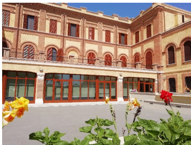
Maison de Rome côté cour, restaurée.

Car Dieu a fait de grandes choses par nos sœurs, elles ont « vécu la Bonne Nouvelle de Jésus-Christ, venu dans le monde pour que les hommes aient la Vie et qu'ils l'aient en abondance. » C. 3. Pour cela, elles se sont mises au service de son royaume par l'éducation des enfants.